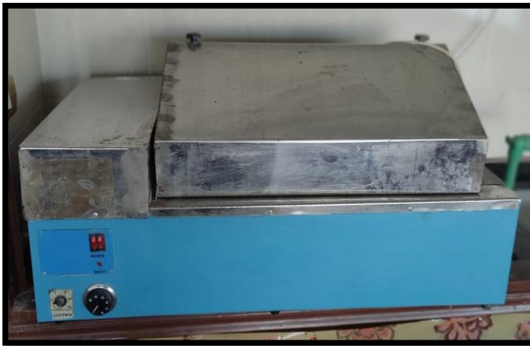
حمام مائي إهتزازي (Shaking water bath)