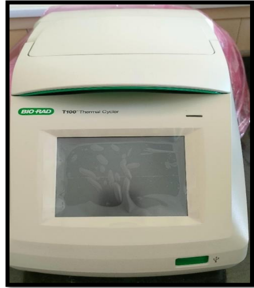
جهاز التدوير الحرارى (Thermal cycler (PCR)