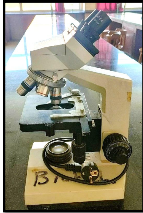
ميكروسكوب مركب (Compound microscope)