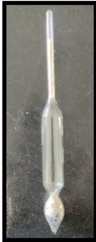
جهاز قياس كثافة السوائل (Hydrometer)