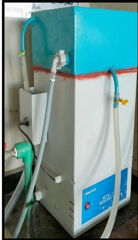
جهاز تقطير المياه (Water distillation unit)