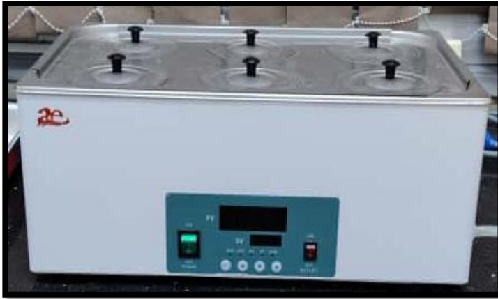
حمام مائي (Water bath)