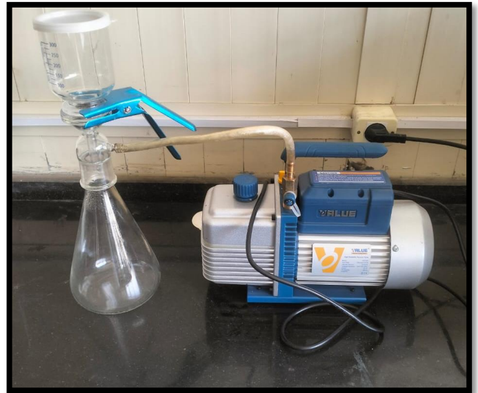
جهاز الترشيح بتفريغ الهواء (Vacuum filtration pump)