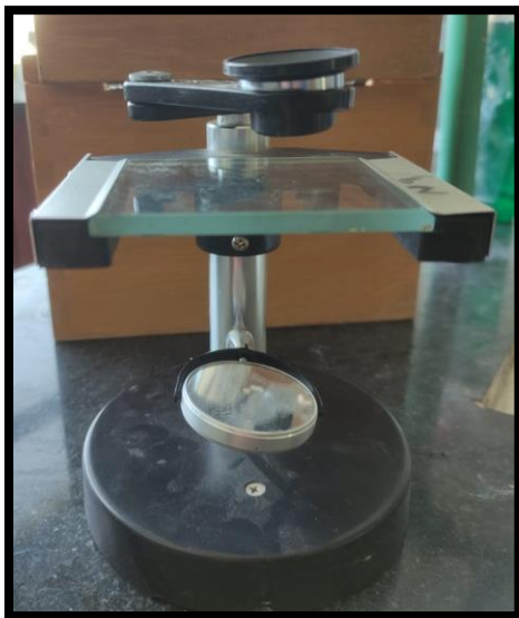
ميكروسكوب بسيط (Simple microscope)