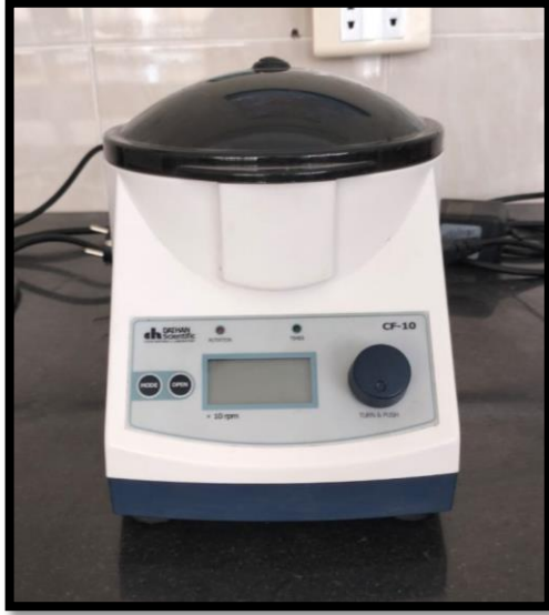
جهاز طرد مركزي صغير (ابندورف) (Eppendorf centrifuge)