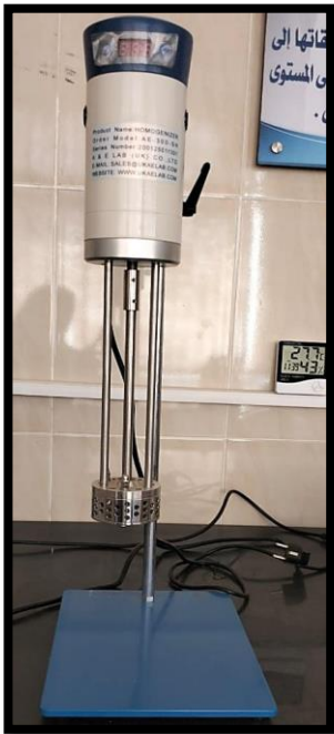
جهاز الخلط (High speed homogenizer)