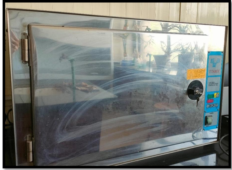
فرن كهربائي (Oven)