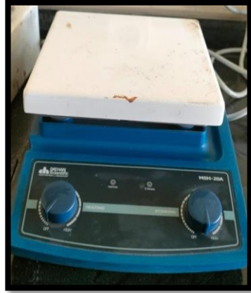
مقلب مغناطيسي مزود بسخان كهربائي (Magnetic stirrer with hot plate)