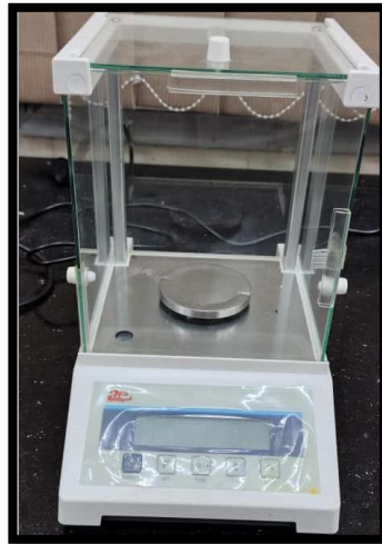
ميزان كهربائي (Electrical balance)