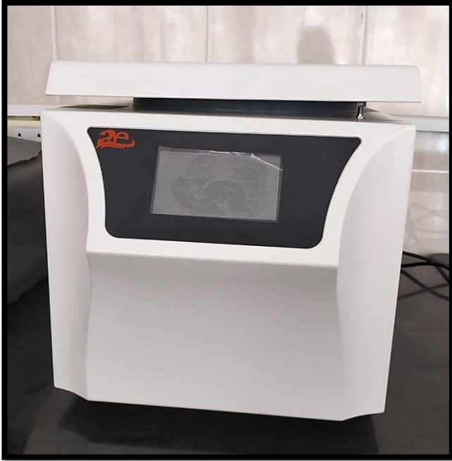
جهاز الطرد المركزي المبرد (Cooling centrifuge)