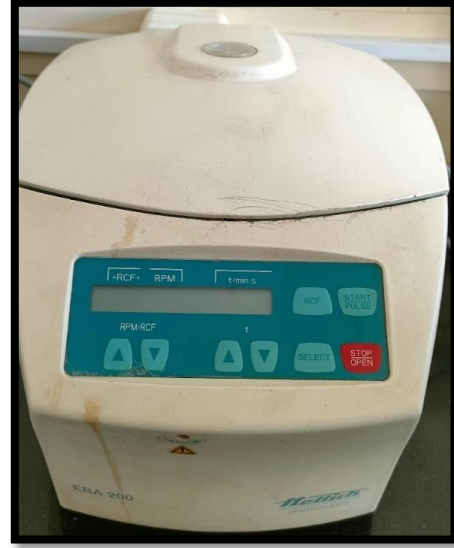
جهاز الطرد المركزي (Centrifuge)