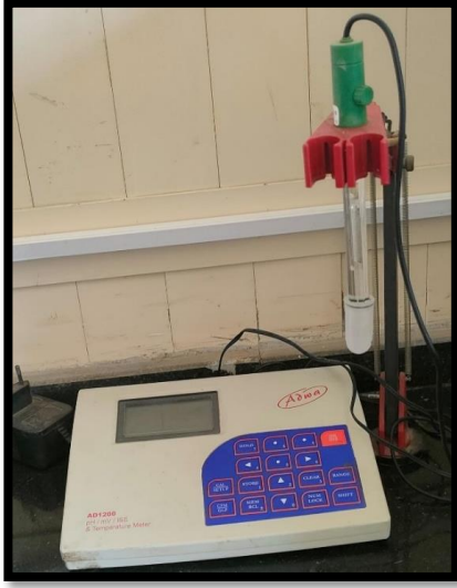
جهاز قياس الرقم الهيدروجيني (pH meter)