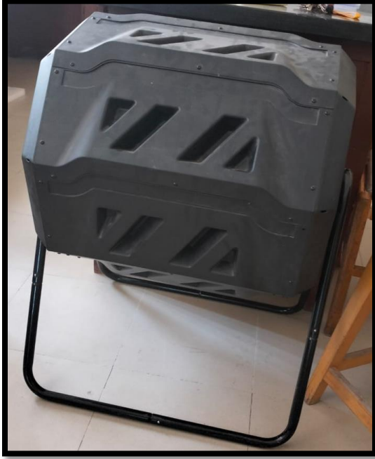
حاوية تدوير المخلفات العضوية (Organic Waste Recycling Unit)