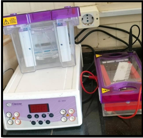
جهاز التفريد الكهربى (Electrophoresis)