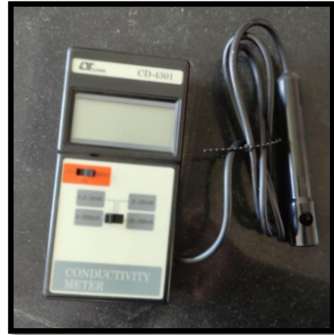
جهاز قياس التوصيلية الكهربائية (Electrical conductivity meter)